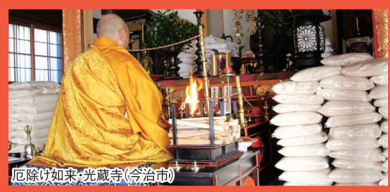
厄除け如来光蔵寺(今治市)